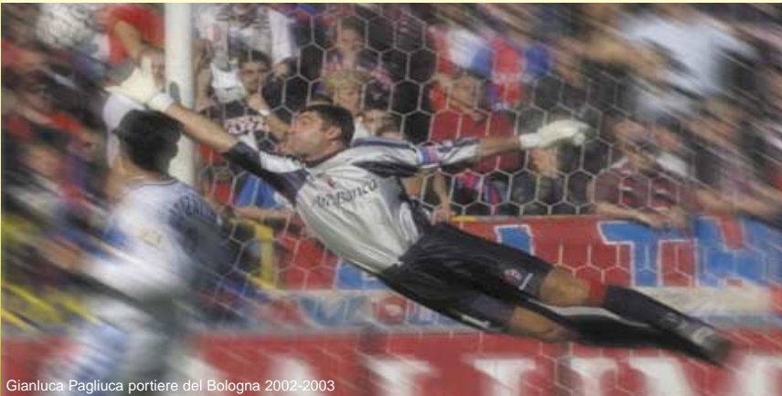
Gianluca Pagliuca portiere del Bologna 2002-2003