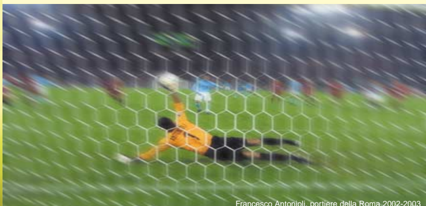
Francesco Antonioli, portiere della Roma 2002-2003

Tutti gli allenatori e i preparatori dei portieri che vorranno seguire le lezioni saranno graditi ospiti e lo potranno fare direttamente dal campo. In particolare il gruppo "Over" avrà contenuti tecnici rivolti soprattutto a quest'ultimi.