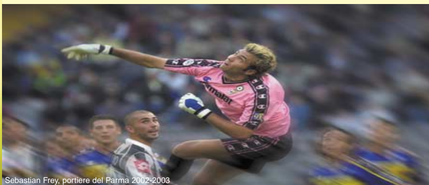
Sebastian Frey, portiere del Parma 2002-2003

Oltre al sito internet www.apport.it l'associazione pubblicherà un giornalino al fine di promuovere l'iniziativa in tutte le regioni italiane creando una rete di collaborazione e scambio di idee fra preparatori dei portieri di calcio.