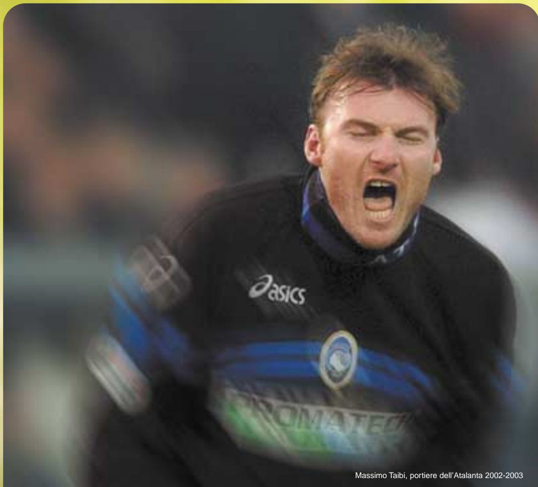
Massimo Taibi, portiere dell'Atalanta 2002-2003

Loc. Roda, 29017 Fiorenzuola d'Arda, PC Tel. +39 0523 984898 Fax 0523 984899