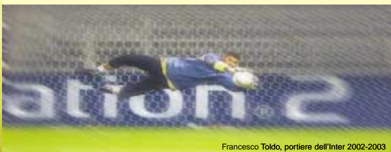
Francesco Toldo, portiere dell'Inter 2002-2003

SISTEMI INFORMATICI WEB SOLUTIONS FAX FOTOCOPIATORI