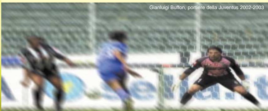
Gianluigi Buffon, portiere della Juventus 2002-2003